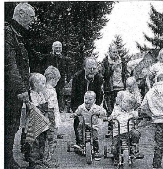
Eine Dreirad-Rallye bringt die ersten Spenden ein.

Die Finanzierung erfolgt über die Einnahmen des Aktionstages, Eigenmittel, Spenden, Lottomittel, Eigenleistungen und einen Zuschuss der politischen Gemeinde. Insgesamt sind die Bauarbeiten an den Außen-